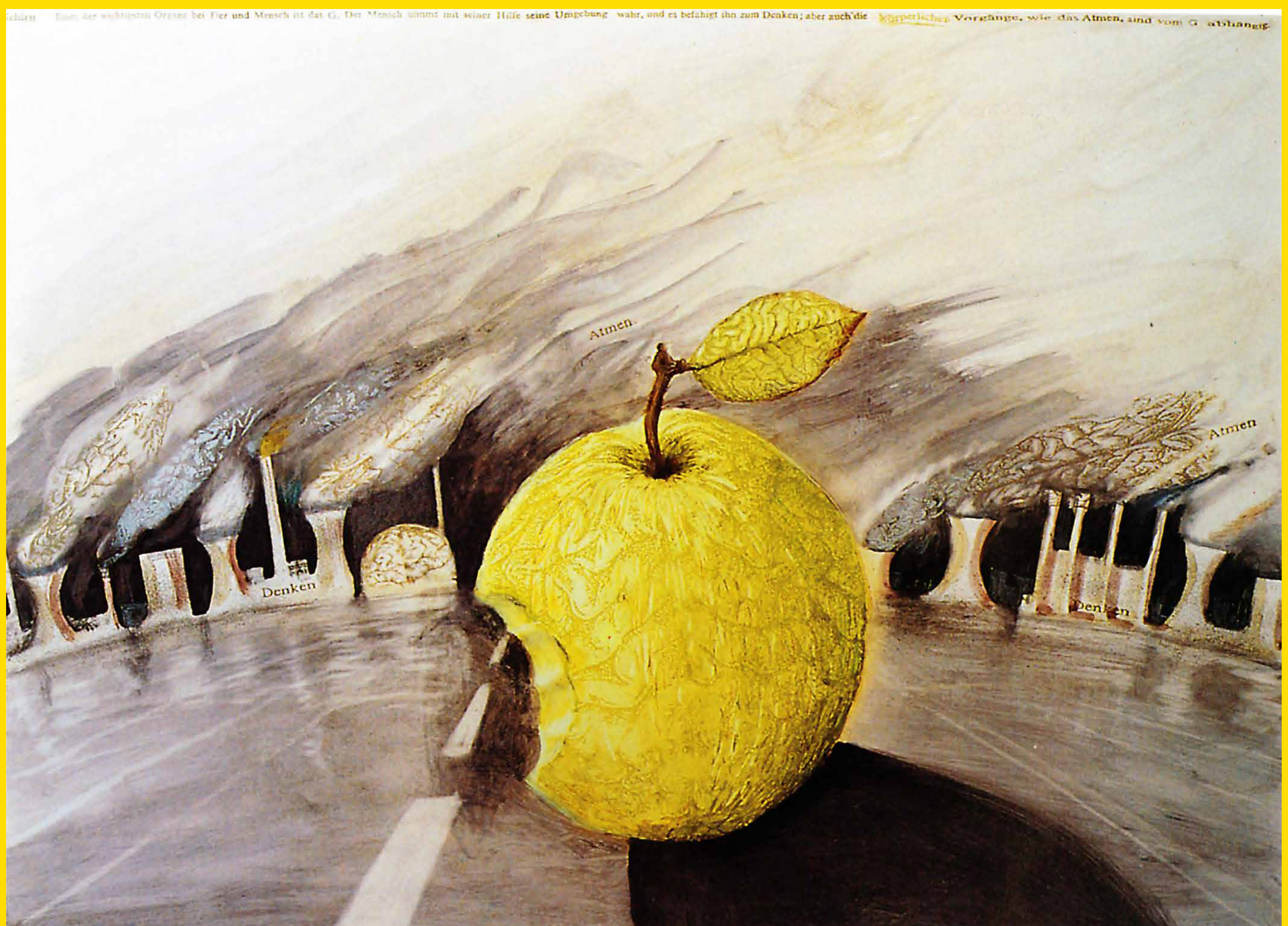
„Adams Apfel“, 1988